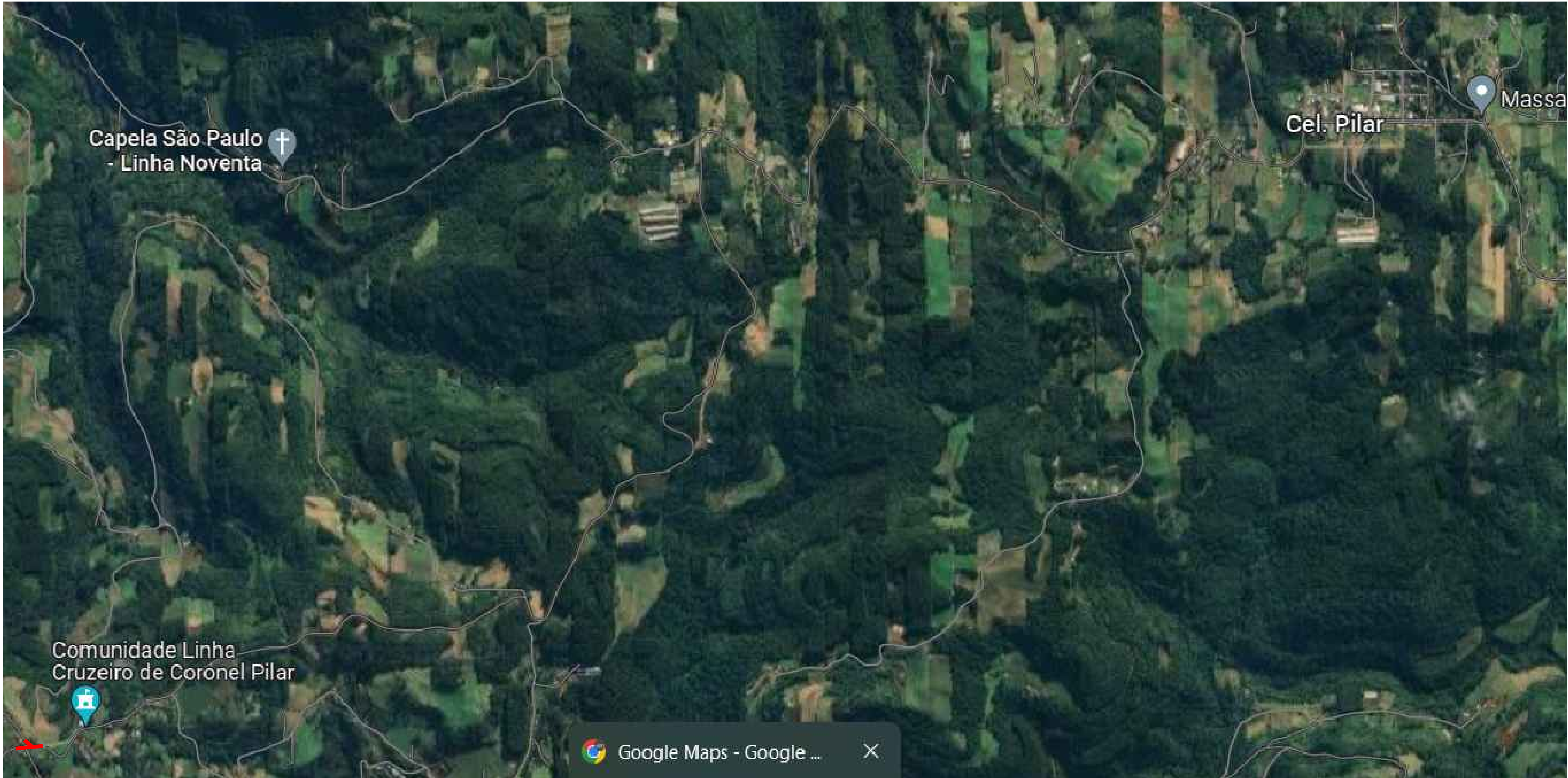
PLANTA DE LOCALIZAÇÃO